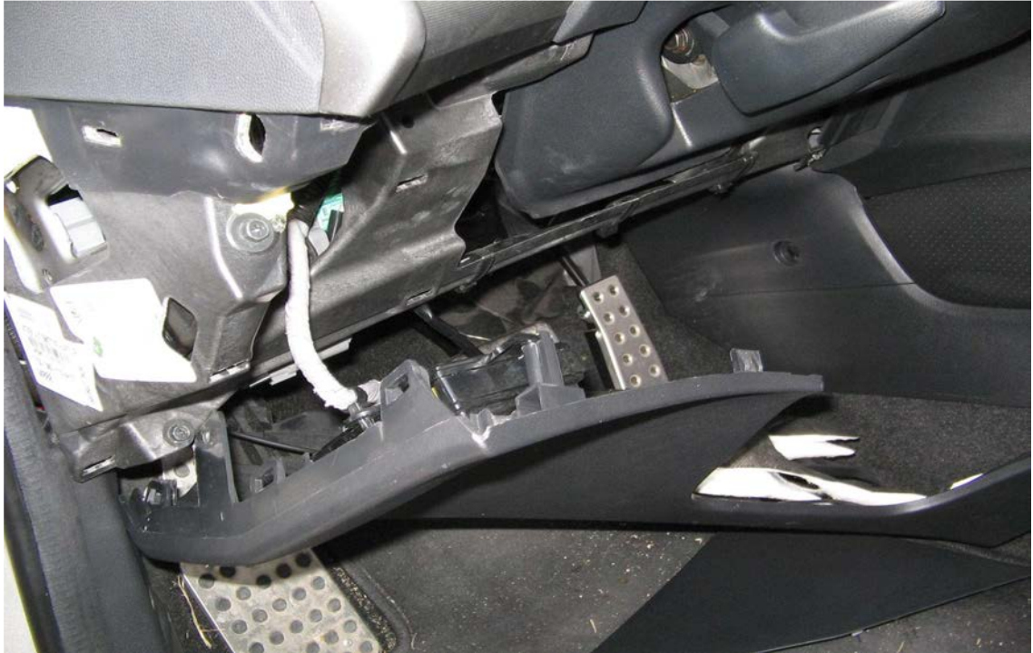
Figure 8. Résultat : la garniture inférieure déclipée

La garniture plastique reste pendue par des fils, on la laisse comme ça jusqu'à la fin de ce tutoriel.