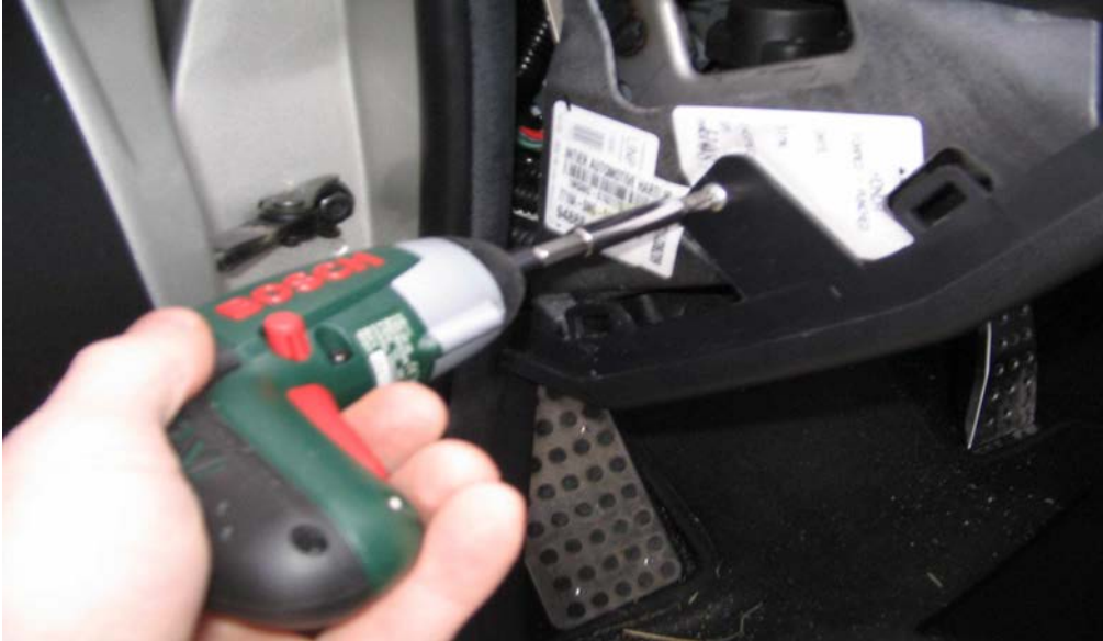
Figure 4. Dévisser la vis retenant la partie inférieure du tableau bord

A l'aide d'un tournevis, dévisser la vis de fixation de la partie inférieure du tableau de bord.