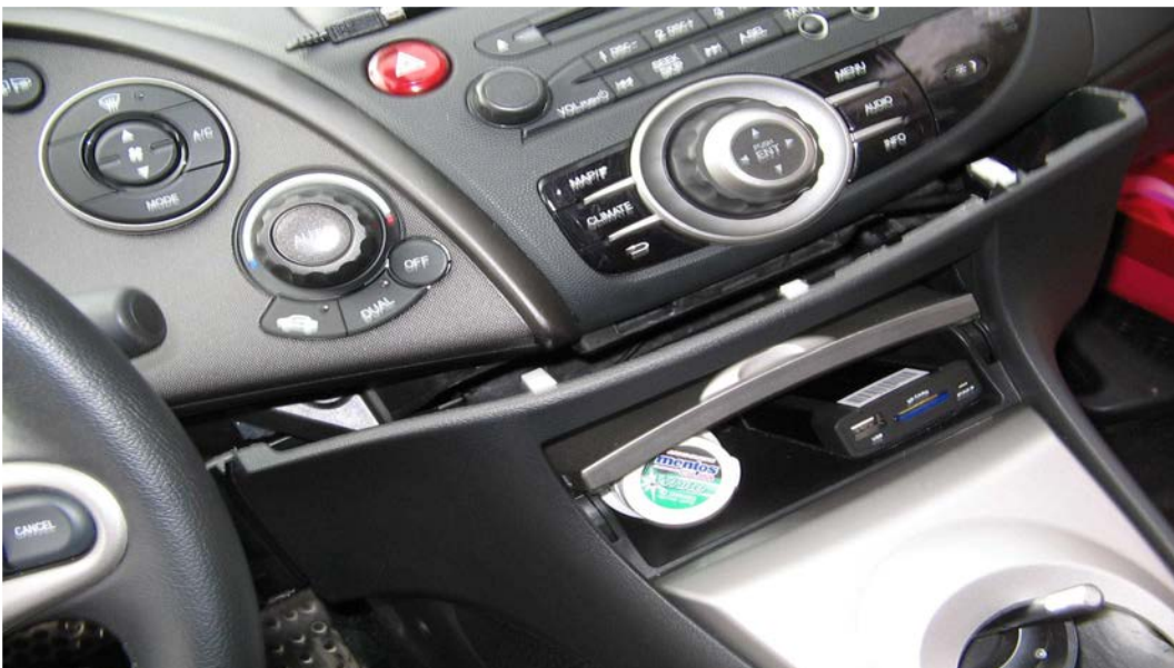
Figure 25. Déclipser la console (partie avant avec boîte à gants)

Ici, il y a peut-être une vis de chaque côté : sur la photo ci-dessus, voir au dessus de la pédale d'accélération, il y a un trou (aurais-je perdu les vis d'ici ?) Si vous pouviez regarder dans vos civic, ca m'arrangerait.