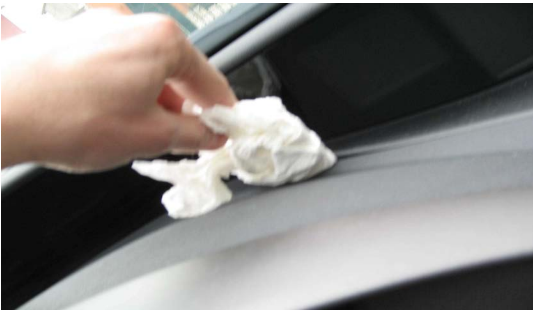
Figure 30. Passer un couteau avec mouchoir (pour ne rien abimer) en faisant levier