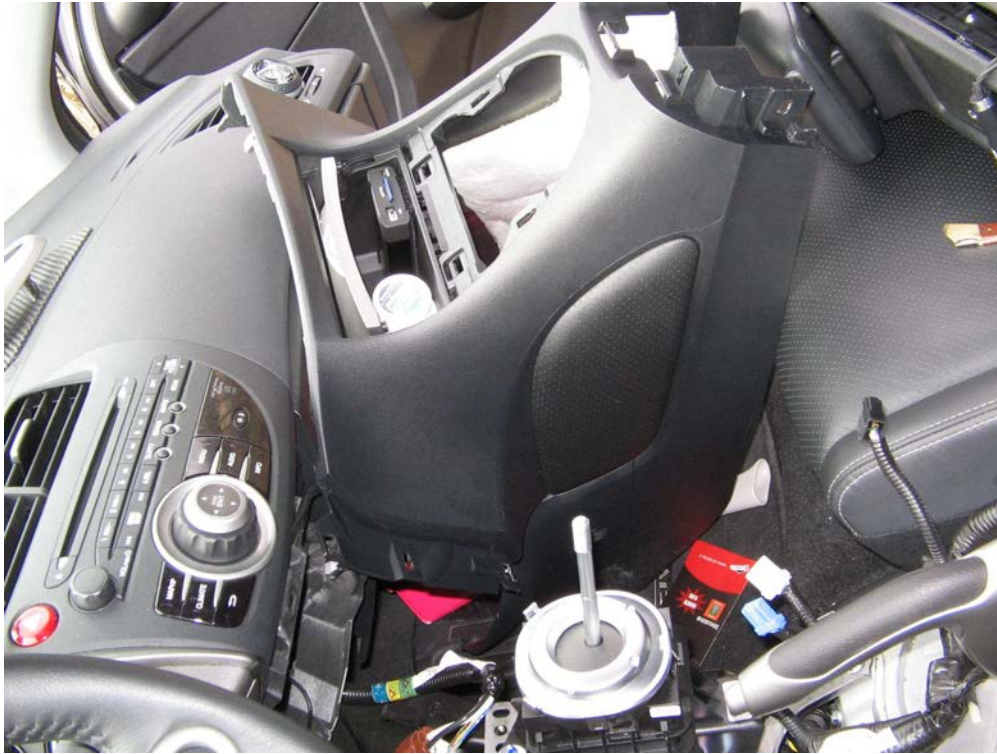
Figure 28. Oter la console avant avec boite à gants