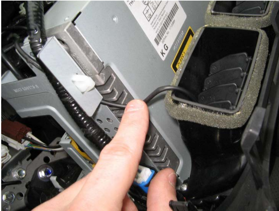
Figure 38. Vue d'un câble USB passé dans la grille d'aération