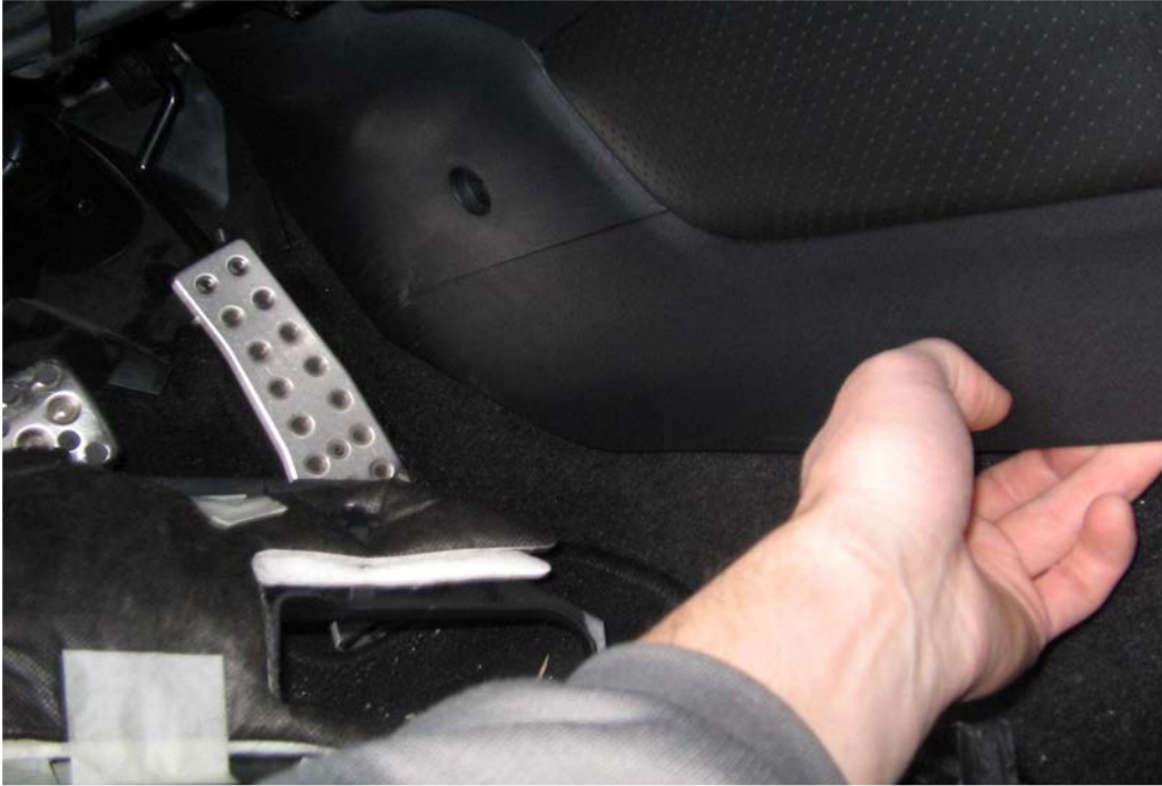
Figure 24. Soulever la console (partie avant avec boîte à gants)