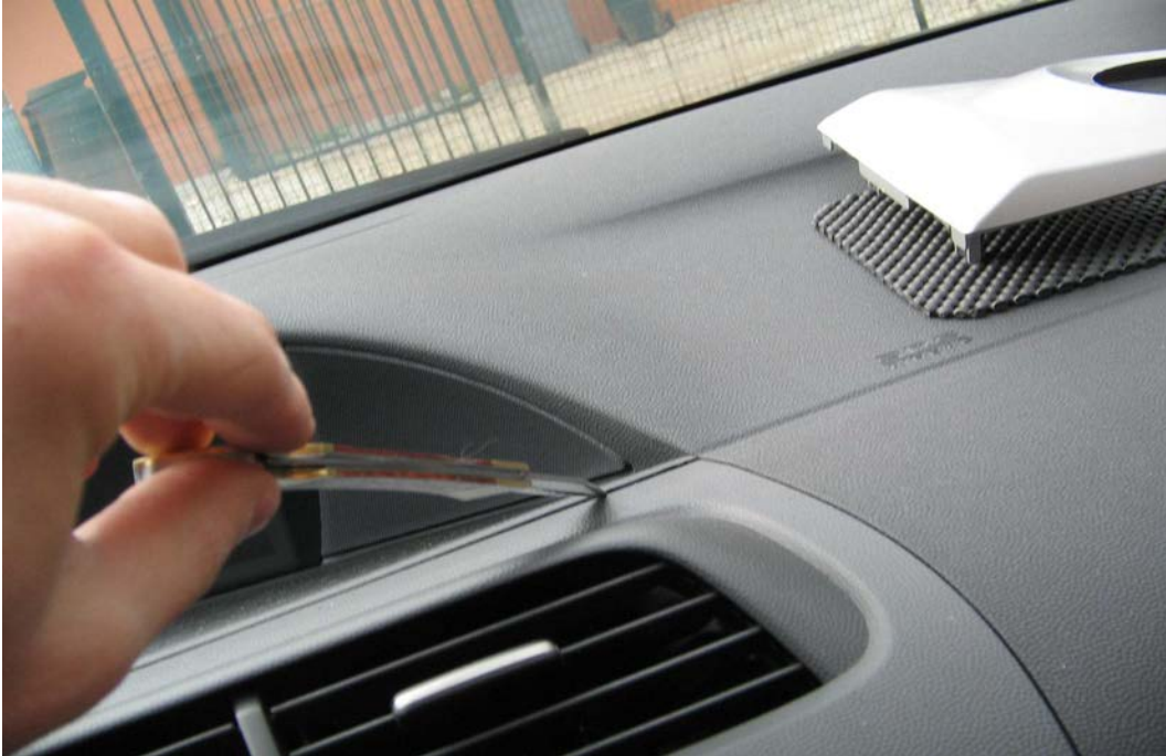
Figure 29. Oter la partie plastique sur l'autoradio avec un couteau