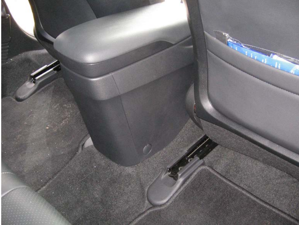
Figure 9. Localiser les deux caches vis de la console à l'arrière

Localisez les deux caches vis de l'accoudoir à l'arrière :