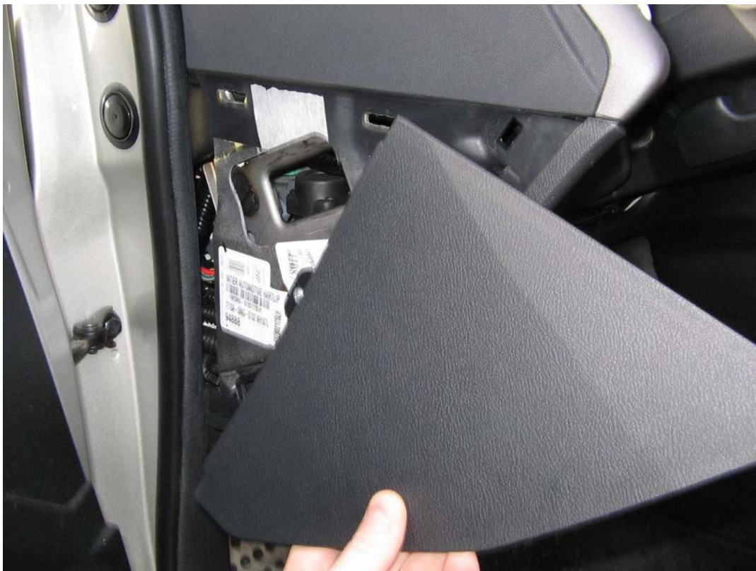
Figure 3. Le triangle plastique enlevé

Libre à vous d'utiliser un mouchoir en papier pour entourer la pointe de votre couteau afin de ne pas abîmer les plastiques, ou bien soyez prudents !