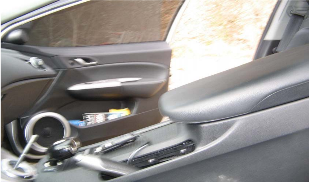
Figure 20. Soulever la console et l'accoudoir pour pouvoir atteindre les prises