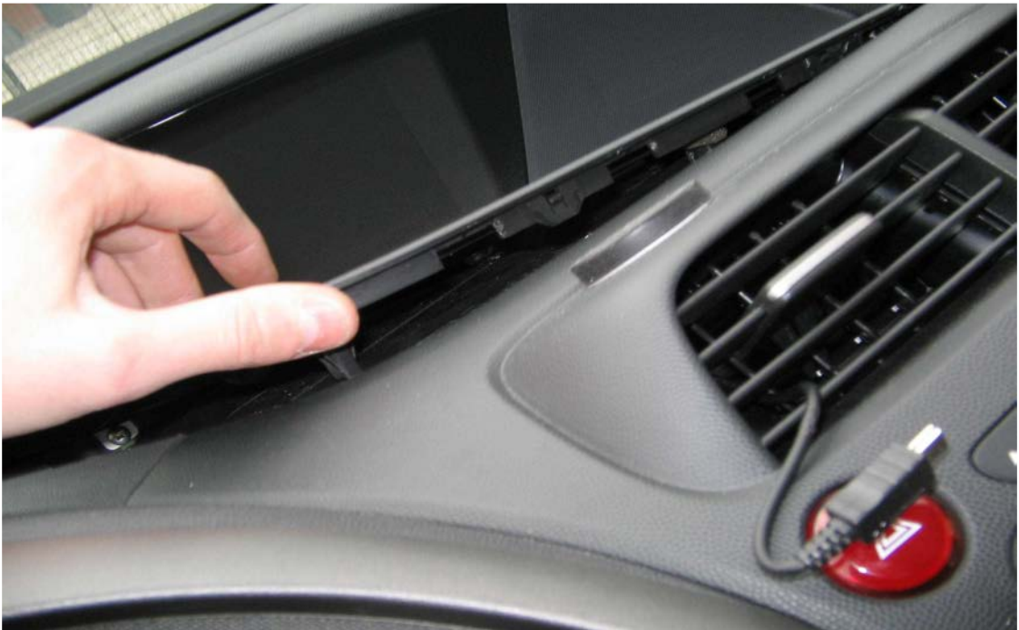
Figure 31. Déclipser la partie plastique