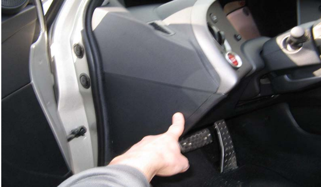
Figure 1. Localiser le plastique triangulaire près du démarreur

Voici la 1 ère pièce de plastique à enlever : le plastique en forme de triangle :