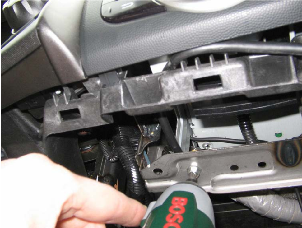
Figure 35. Dévisser les deux vis qui fixent l'autoradio de face