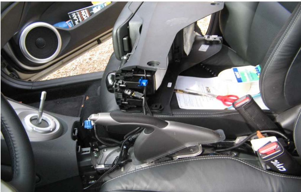
Figure 23. Oter la console et l'accoudoir