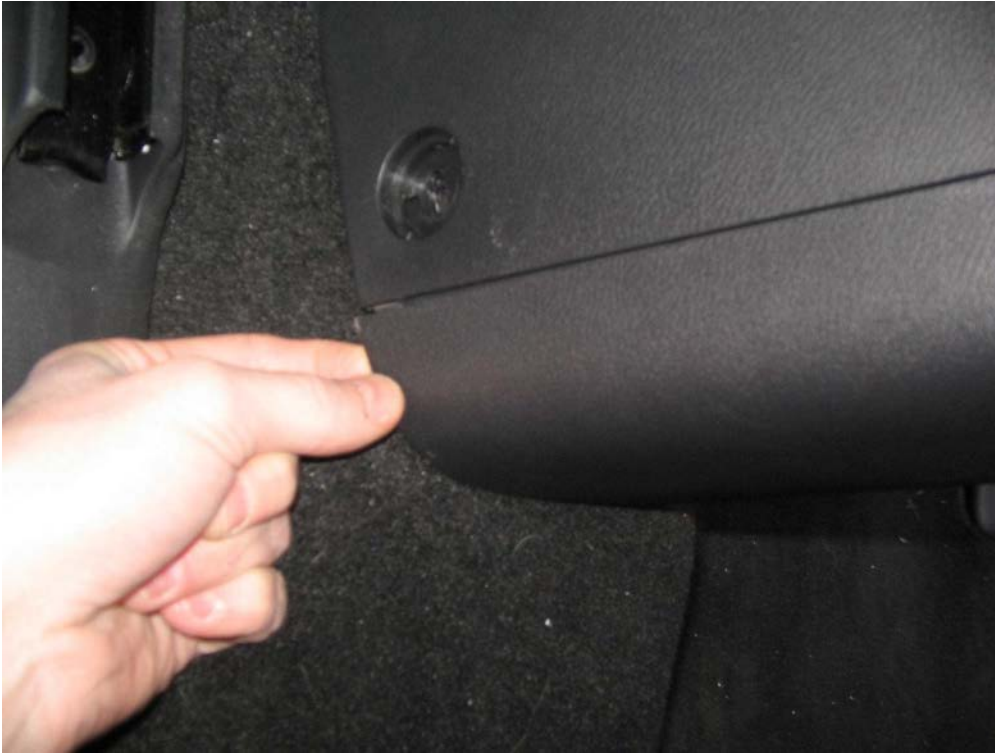
Figure 12. Détacher le fond d'accoudoir