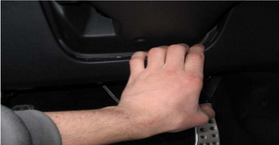
Figure 6. Tirer pour déclipser la garniture inférieure (partie centrale)

Commencez à dégrafer en tirant vers le bas (là où il y a la main sur l'illustration ci-dessus)