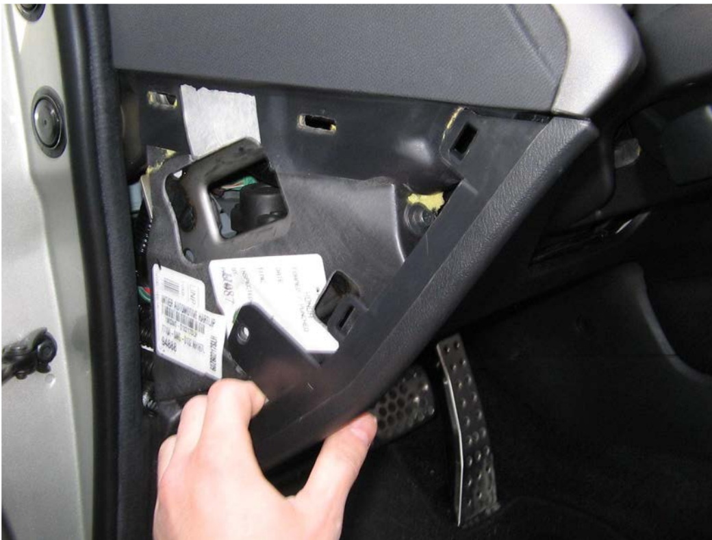
Figure 5. Tirer pour déclipser la garniture inférieure (partie de gauche)

Tirez la garniture plastique vers vous pour la déclipser entièrement.