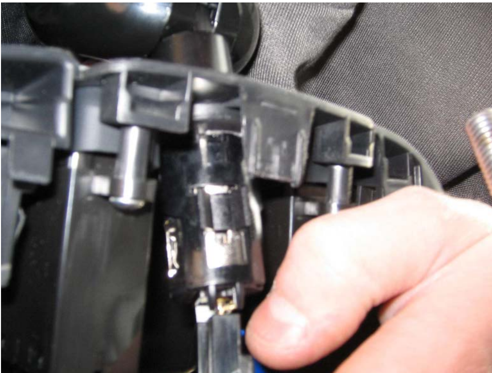
Figure 21. Débrancher la prise allume-cigare