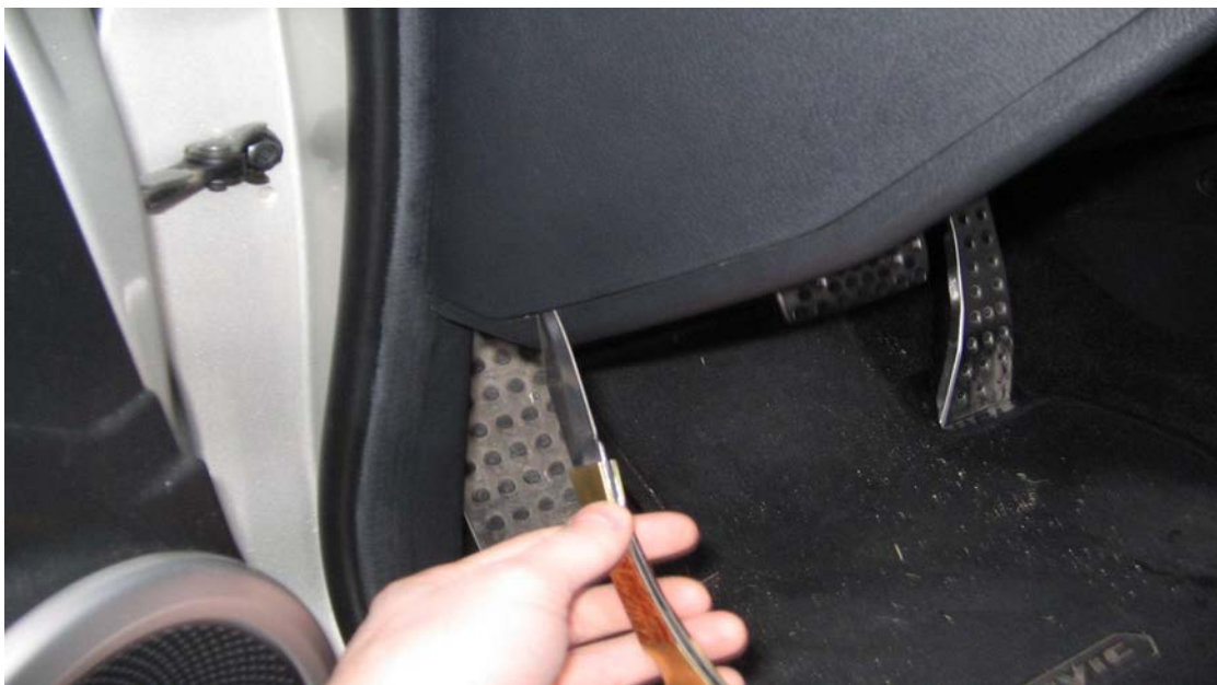
Figure 2. Faire levier avec un couteau pour déclipser le triangle plastique