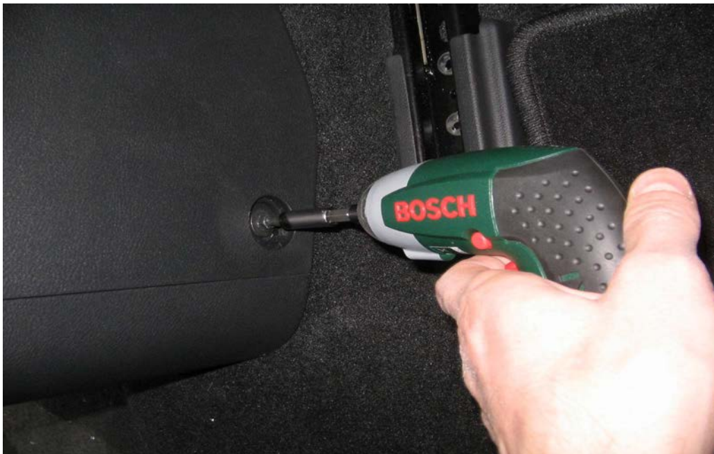
Figure 11. Dévisser les deux vis de la console à l'arrière

A l'aide d'un couteau, ôtez les deux caches vis sans grande difficulté (une de chaque côté de l'accoudoir).