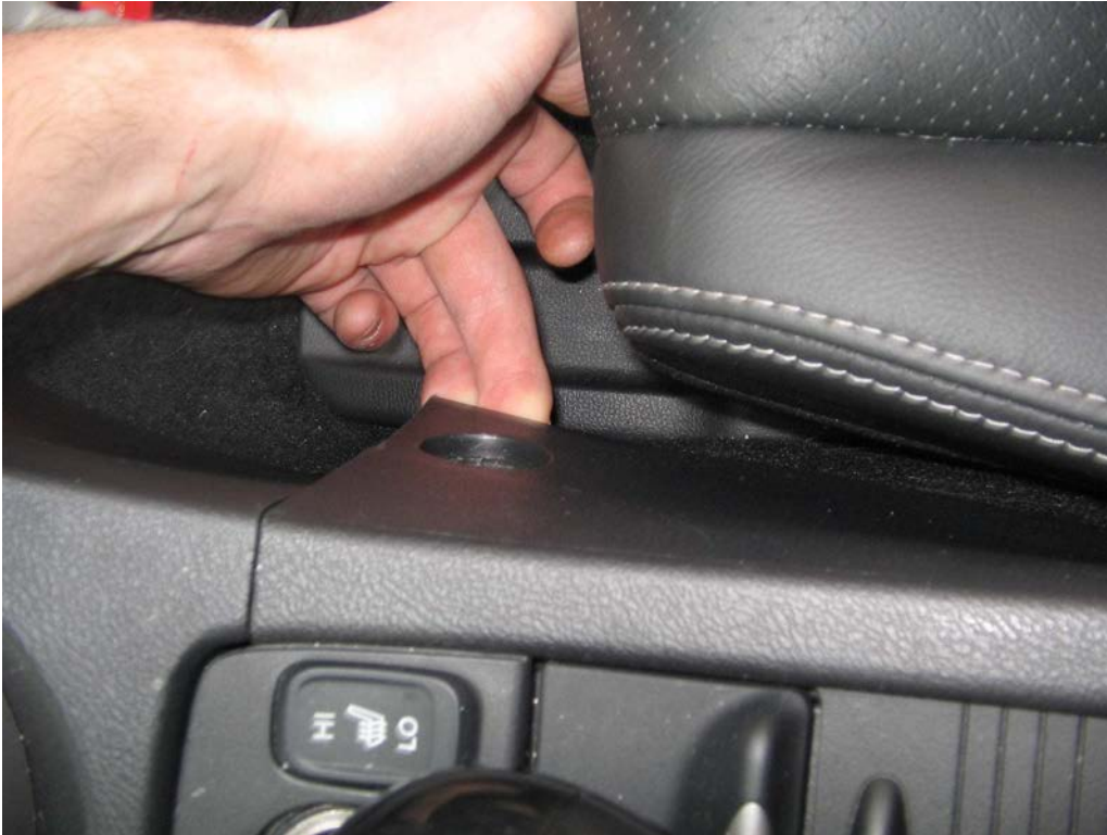
Figure 16. Soulever la console à l'avant par les bords