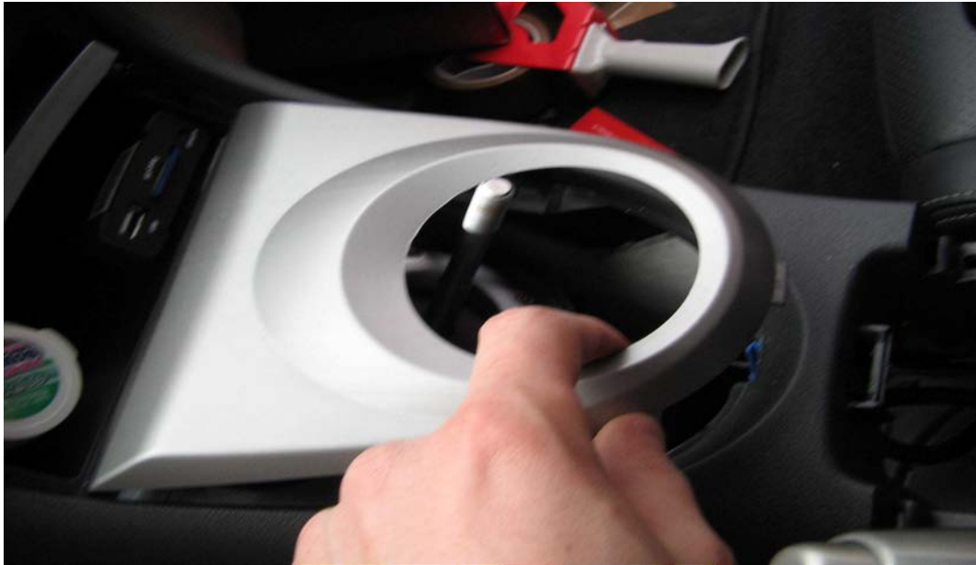
Figure 26. Oter la garniture du levier de vitesse (tirer vers soi)