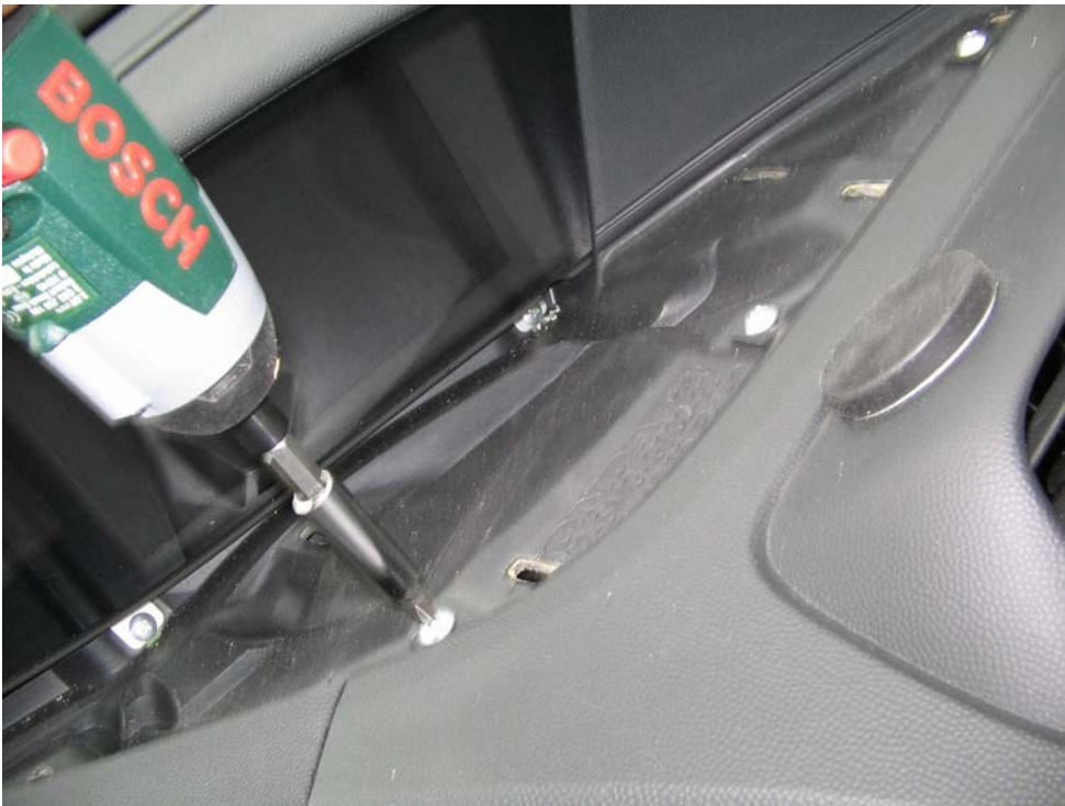
Figure 34. Dévisser les trois vis qui fixent l'autoradio par le haut