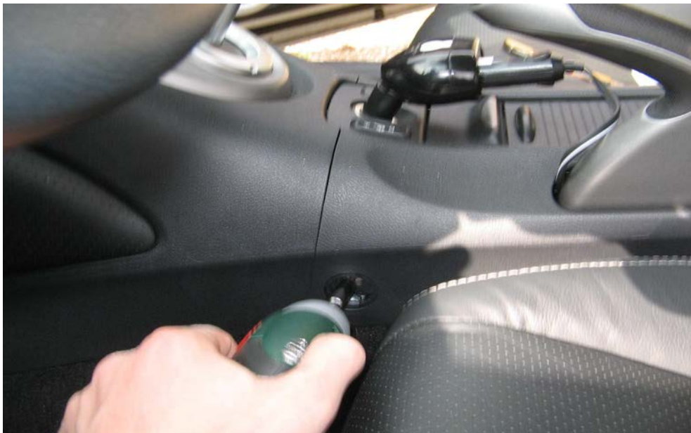
Figure 15. Dévisser les deux vis de la console à l'avant