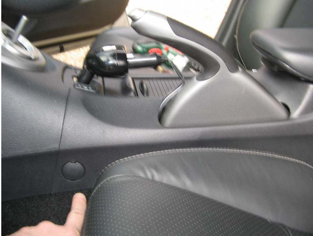
Figure 14. Localiser et déclipser les deux caches vis de la console à l'avant