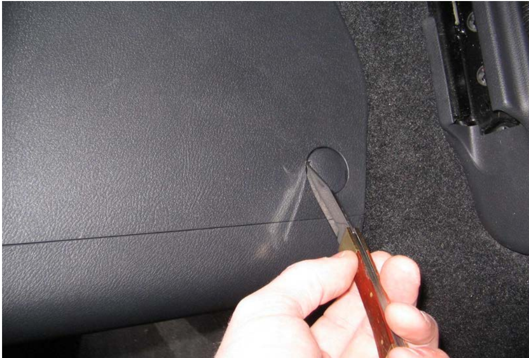
Figure 10. Déclipser les deux caches vis de la console à l'arrière

A l'aide d'un couteau, ôtez les deux caches vis sans grande difficulté (une de chaque côté de l'accoudoir).