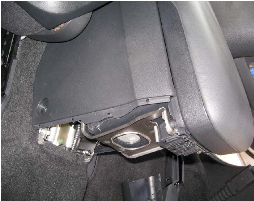
Figure 13. Vue de l'accoudoir sans fond