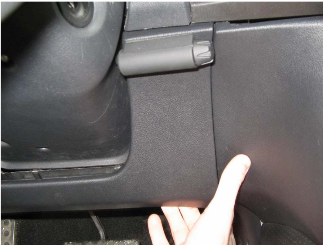
Figure 7. Tirer pour déclipser la garniture inférieure (partie droite)