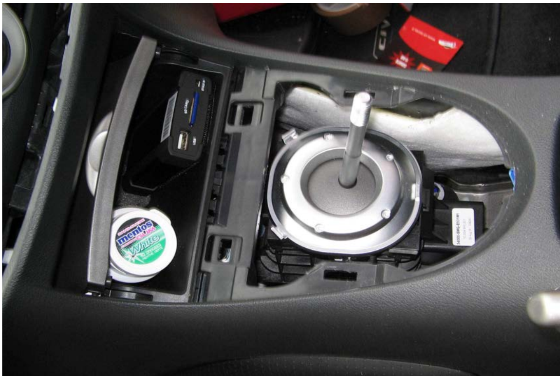
Figure 27. Vue du levier de vitesse à nu