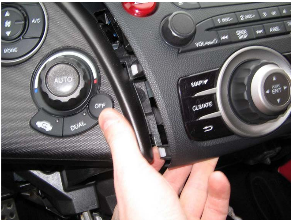
Figure 36. Déclipser l'autoradio en tirant un peu fort vers soi