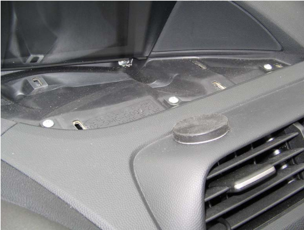
Figure 33. Vue des trois vis à démonter