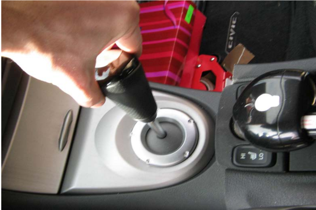
Figure 18. Localiser le levier de vitesse ( ! )