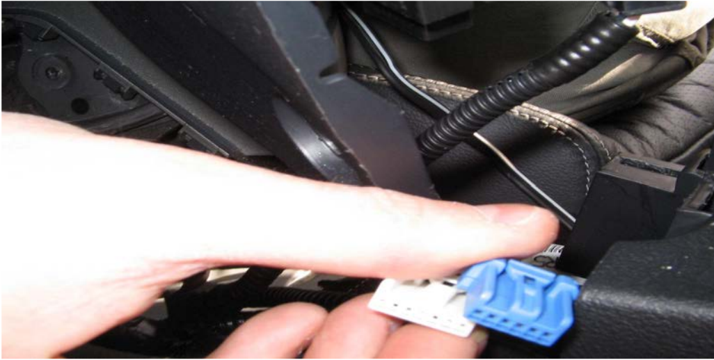
Figure 22. Débrancher les prises sièges chauffants (optionnel)