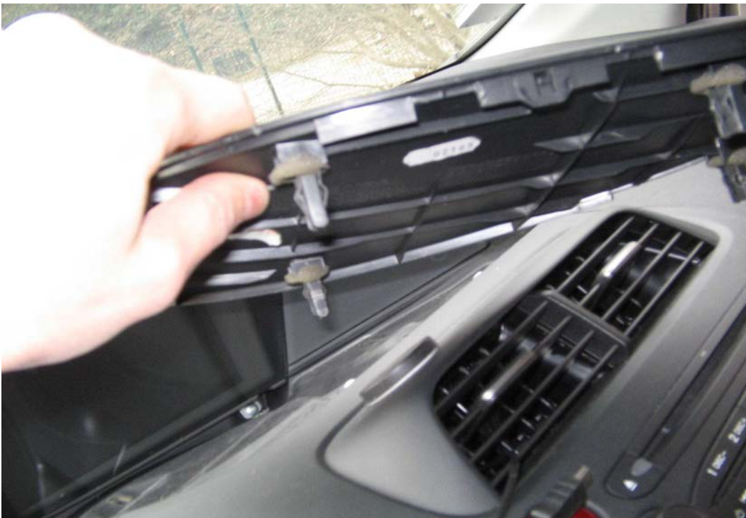
Figure 32. Oter la partie plastique