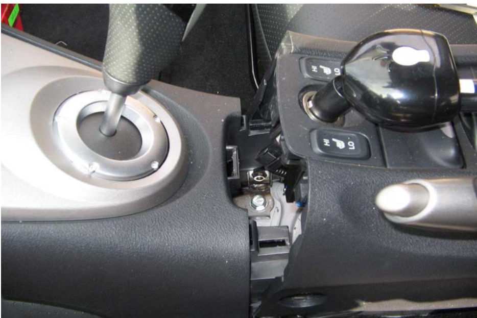
Figure 17. Déclipser la console à l'avant