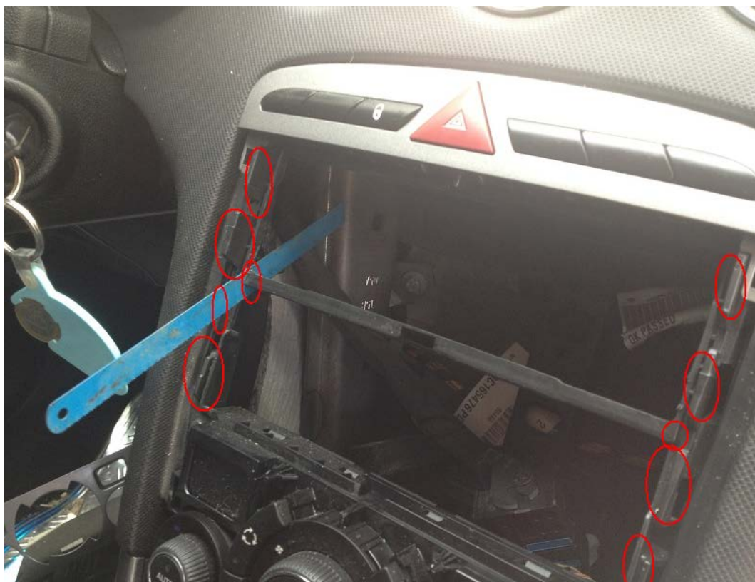
Montage du kit 2 Din.